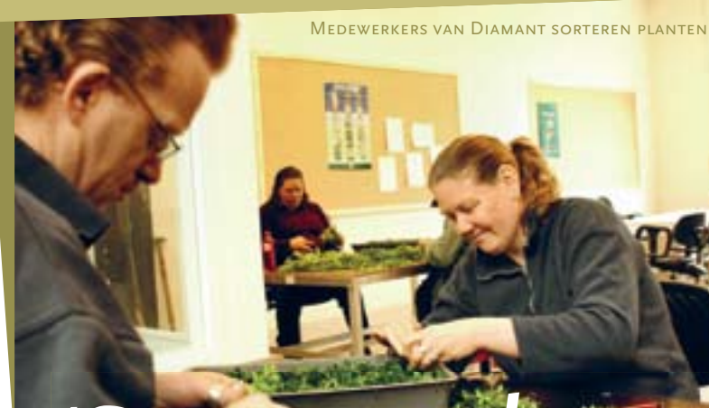
MEDEWERKERS VAN DIAMANT SORTEREN PLANTEN