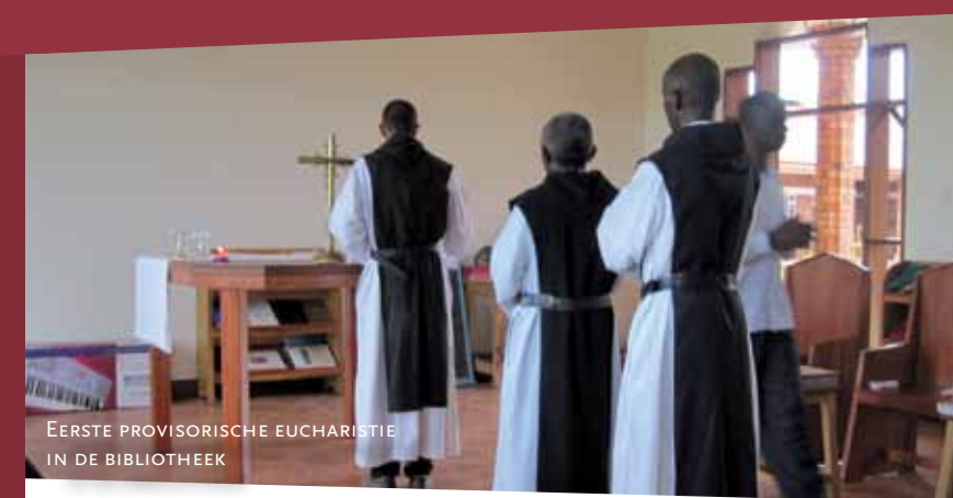
EERSTE PROVISORISCHE EUCHARISTIE IN DE BIBLIOTHEEK