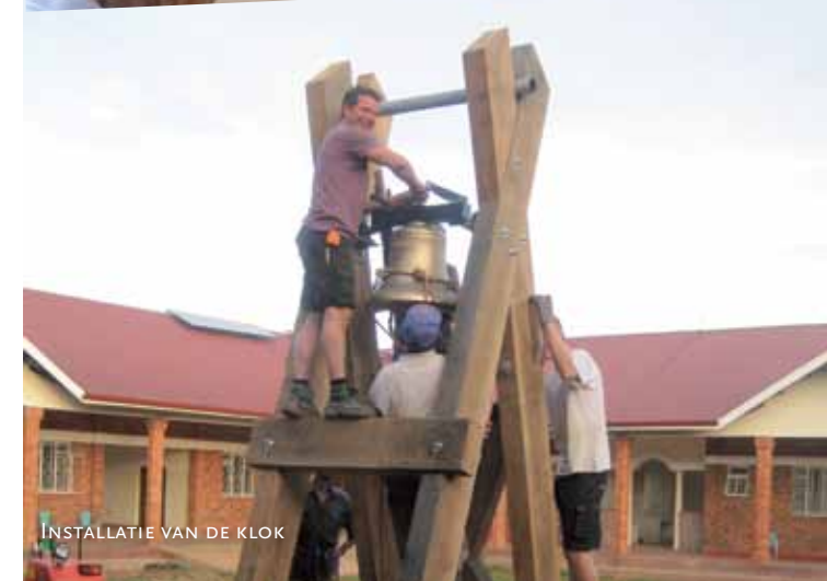
INSTALLATIE VAN DE KLOK