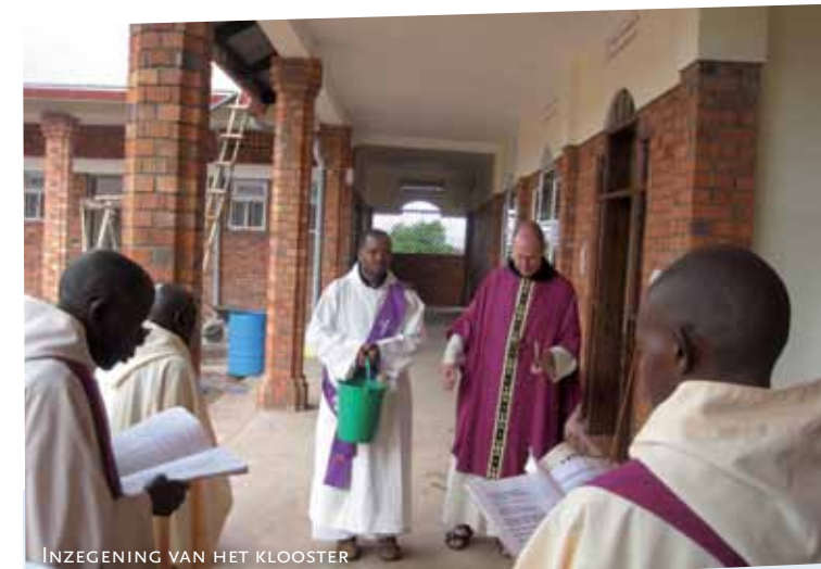
INZEGENING VAN HET KLOOSTER

Op dit moment kunnen de broeders goed leven van de opbrengst van het land. De grond is zeer vruchtbaar en water is er in overvloed. Momenteel zijn er zeventien broeders in het nieuwe klooster, en enkele postulanten. Eén zieke broeder verblijft in de hoofdstad bij zusters van een actieve congregatie die zorg dragen voor ernstig zieke priesters en religieuzen. Zijn toestand gaat echter goed vooruit zodat hij wellicht snel naar huis kan terug keren. Er moet nog het nodige gebeuren in en rond het huis. Daarom zijn de broeders Isaac en Korneel in september naar Oeganda gegaan om dat allemaal te regelen. Als alles goed gaat wordt het nieuwe klooster op 8 december officieel in gebruik genomen met een altaarwijding door bisschop Kaggwa. Op die datum is de gemeenschap in 1956 in Kenia begonnen.