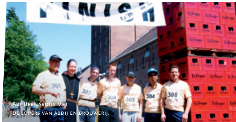
ABT BERNARDUS MET DE LOPERS VAN ABDIJ EN BROUWERIJ.

Het evenement was een van de voorbereidingslopen op de Brabants Dagblad Tilburg Ten Miles , zondag 4 september. Op de paden en wegen van het abdijterrein was een fraaie ronde uitgezet van 5 kilometer (verhard en onverhard) door een prachtige omgeving die doorgaans slechts toegankelijk is voor de gasten die in het gastenhuis verblijven. Van het inschrijfgeld, tien euro per loper, gaat driekwart naar het restauratiefonds van de abdij.